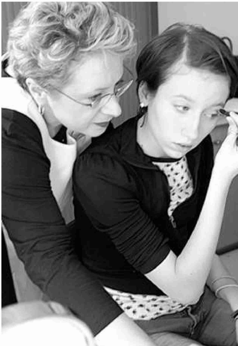
Individuelle Betreuung: Eine Kosmetikerin steht der Teilnehmerin eines Workshops in Frankreich mit Rat und Tat zur Seite.